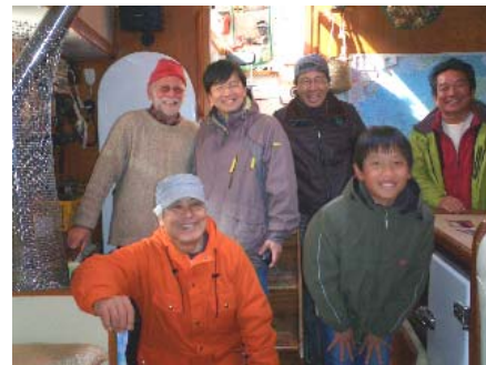
船内にて左上の船長と記念撮影