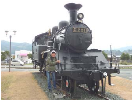
JR内子駅前の蒸気機関車

今日は、長浜港から郡中港に行きました。お昼ご飯を食べてから内子まで行って観光をしました。内子座などに行きました。でもほとんど休みでした。内子座には、浮世絵がありました。そして帰りに、機関車があったので写真をとりました。そして、晩ご飯は、一日目がごうかだったので、サンドイッチなどでした。明日も楽しみたいです。今日は、一人下船して六人になりました。