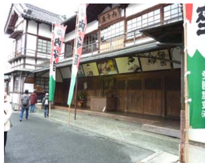
内子座 (年末の為休館)