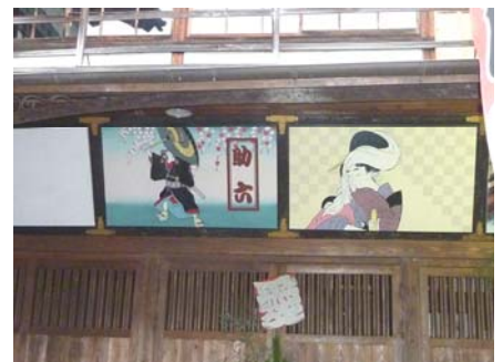
内子座の浮世絵看板