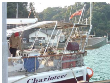
船名の Charioteer は<古代軽戦車の御者>